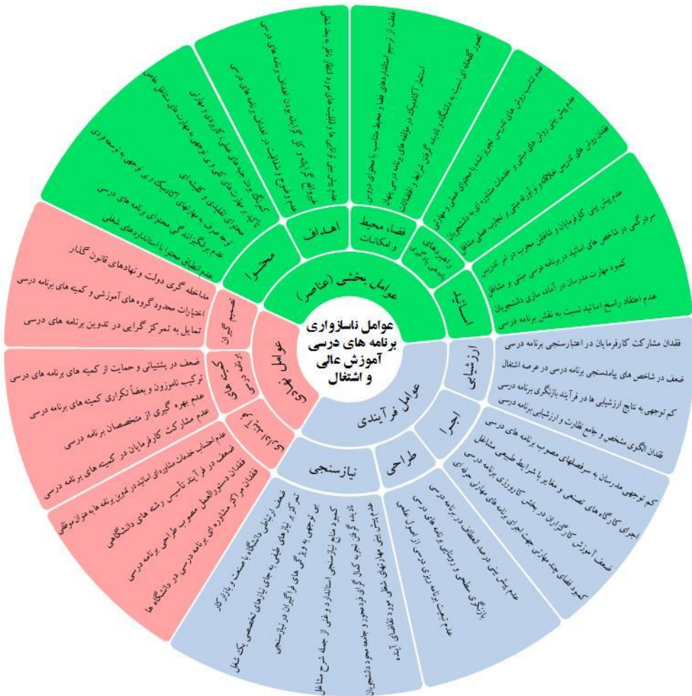
شکل ۲. الگوی مفهومی عوامل ناسازواری برنامه های درسی آموزش عالی با اشتغال

در ادامه به منظور پاسخ به سؤال دوم پژوهش و اولویت بندی عوامل شناسایی شده با استفاده از روش تحلیل سلسله مراتبی گروهی، فاکتور «حرفه ای بودن» (با تعریف عملیاتی: میزان انطباق با مشاغل) به عنوان معیار اولویت بندی مدنظر قرار گرفت، براین اساس ساختار درخت سلسله مراتب در دو سطح تشکیل شد. در سطح اول با هدف مقایسه ۳ مقوله اصلی (عوامل فرآیندی، عوامل نهادی و عوامل بخشی) و در سطح دوم با هدف مقایسه ۱۲ مقوله فرعی و تعیین اولویت آنها با فاکتور حرفه ای بودن، درخت سلسله مراتب ترسیم شد. در گام بعد باید کلیه عوامل در هر دو سطح دوبه دو مقایسه می شدند و میزان ارجحیت هر عامل با عوال رقیب سنجیده می شد.