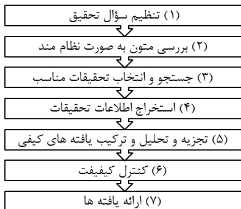
شکل ۱. گام‌های فرا ترکیب

به‌منظور تجزیه و تحلیل و ترکیب یافته‌های مطالعات قبلی (پنجمین گام از فرا ترکیب) براساس آنچه که پیش‌تر بیان شد از روش تحلیل محتوا استفاده شده است. در این مرحله ضمن استخراج عبارات، مفاهیم، مضامین و مؤلفه‌های اصلی بیان شده در پژوهش‌های قبلی درخصوص عوامل این ناسازواری، از نرم افزار تحلیل کیفی اطلس تی آی (ATLAS.ti) به‌عنوان یک نرم افزار تئوری‌ساز مبتنی بر کد، که از امکانات و قابلیت‌هایی از قبیل امکان کدگذاری متن، تخصیص کدها به مفاهیم و مضامین، مرتبط کردن یادداشت‌های پژوهشگر با کدها، قابلیت جست‌وجوی پیشرفته، عملیات بازخوانی داده‌های کدگذاری شده و تولید شبکه‌های معنایی برخوردار است استفاده شده است. در ادامه برای کسب اطمینان و تضمین کیفیت یافته‌ها ضمن تلاش برای انتخاب هدفمند و اصولی مقالات مرتبط از منابع اصیل و معتبر و همچنین پالایش گام‌به‌گام و دقیق مقالات، در فرآیندی جداگانه مقالات نهایی در اختیار یک نفر ارزشیاب که نسبت به موضوع آشنایی کافی داشت قرار گرفت تا ضمن کدگذاری مجدد و مقایسه با نتایج کدگذاری پژوهشگر بتوان نسبت به میزان توافق نظرات، تضمینی درخصوص پایایی آن ارائه نمود؛ از این‌رو پس از کدگذاری مجدد، داده‌های مربوط به کدهای باز در نرم‌افزار SPSS وارد و ضریب کاپای کوهن به میزان ۰,۹۴ محاسبه شد که بیانگر توافق بالای نظر پژوهشگر و ارزشیاب در کدگذاری-هاست.