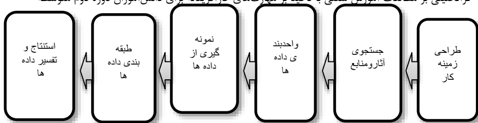
شکل ۱. فرآیند انجام پژوهش با روش فراتحلیل کریبندروف (۲۰۲۳)

بر اساس فرآیند شکل ۱، ابتدا بر اساس روش مرور منظم، کلیه مولفه‌های مرتبط با آموزش کارآفرینی جمع‌آوری گردید. برای وارد کردن هر پژوهش در فراتحلیل ملاک‌های زیر در نظر گرفته شد: ۱. گزارش پژوهش به صورت مقاله در مجلات علمی- پژوهشی چاپ شده باشد. ۲. پژوهش به مولفه‌های آموزش مهارت‌های کارآفرینی برای دانش‌آموزان پرداخته باشد. ۳. پژوهش به لحاظ روش شناختی درست باشند. ۴. پژوهش در فاصله سال‌های ۱۳۸۸ تا ۱۴۰۱ انجام شده باشد. با توجه به ملاک‌های ورود، مقالات مرتبط با آموزش کارآفرینی شناسایی و بررسی شدند. با استفاده از روش نمونه‌گیری تمام شماری، ۳۵ مقاله انتخاب و داده‌ها طبق رویکرد فراتحلیل استقرایی (از جزء به کل) استخراج و طبقه‌بندی و مراحل کدگذاری و تحلیل انجام شد. طبقه‌بندی داده‌ها در سه بخش یافته‌های توصیفی، یافته‌های مرتبط با روش‌شناسی و یافته‌های رویکردی تنظیم شدند و بر اساس یک فرآیند اکتشافی، داده‌ها تحلیل و تفسیر شدند و نتایج نهایی گزارش شد.