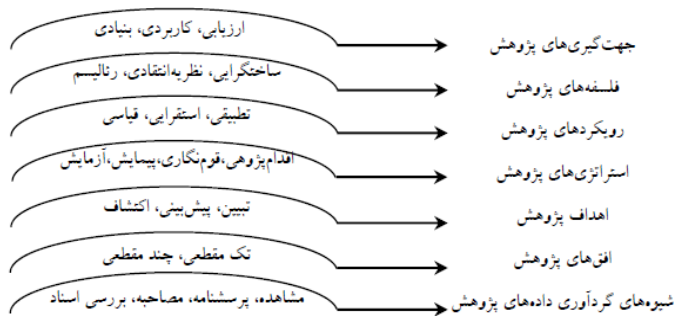
شکل ۳. پیاز فرآیند پژوهش (اقتباس از ساندرز و همکاران، ۲۰۱۹)

در این بخش دوم، فراتحلیل بر اساس چارچوب روش‌شناسی معروف به پیاز پژوهش ساندرز، لویس و تورنهییل ۱ (۲۰۱۹) تحلیل شد.