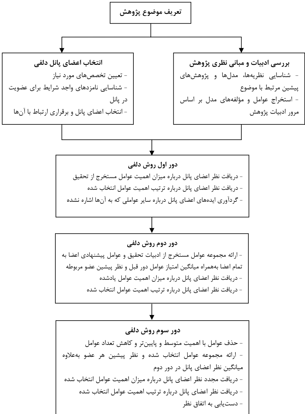
شکل ۲. فرآیند اجرای روش دلفی